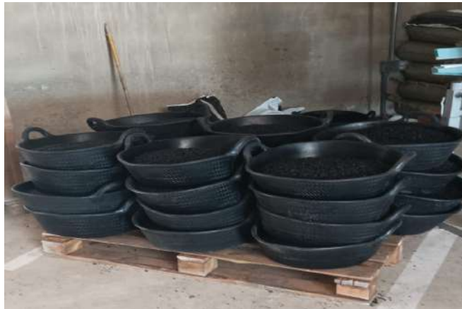
Sacos 25 kg